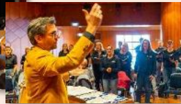
2024 Badischer Chortag „Wir singen Zukunft!“ Zukunftswerkstatt Bruchsal Bürgerzentrum