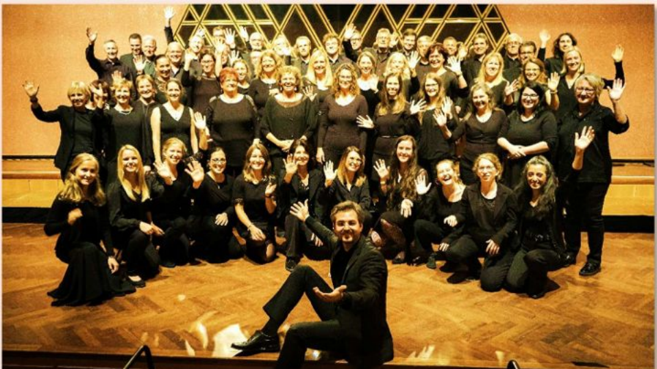
2022 Badischer Chorwettbewerb Titel Meisterchor, Bruchsal Bürgerzentrum