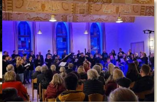
2023 Landesmusikfestival BW #musophieren Bruchsal Bürgerzentrum