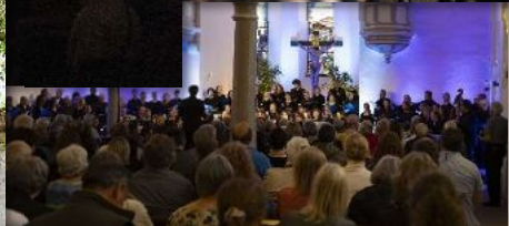
2024 Fotosession, Bruchsal St. Paulusheim