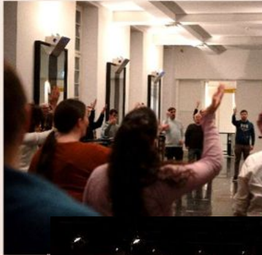
2026 Karlsruher PROMS XXL Karlsruhe Konzerthaus