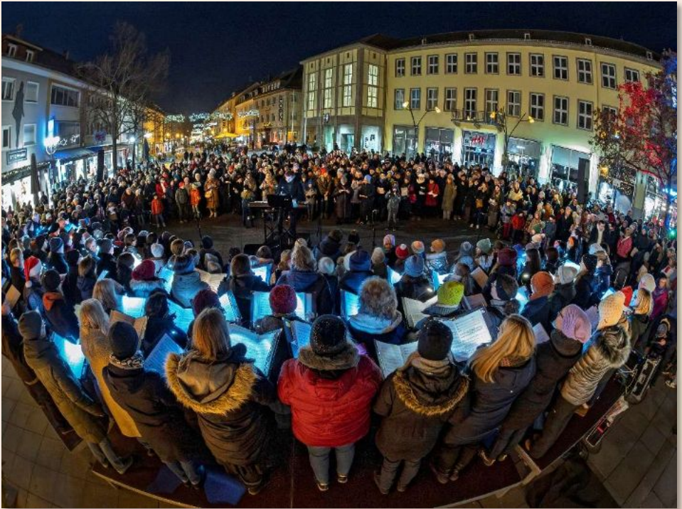
2025 Sin(g)voller Advent 2.0, Marktplatz Bruchsal