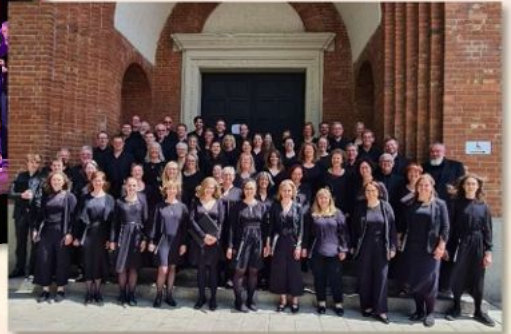
2025 Deutsches Chorfest Nürnberg 2. Preis Kategorie Romantik weltlich