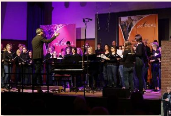
2025 Sin(g)voll - Das Event Forst Alex-Huber-Forum