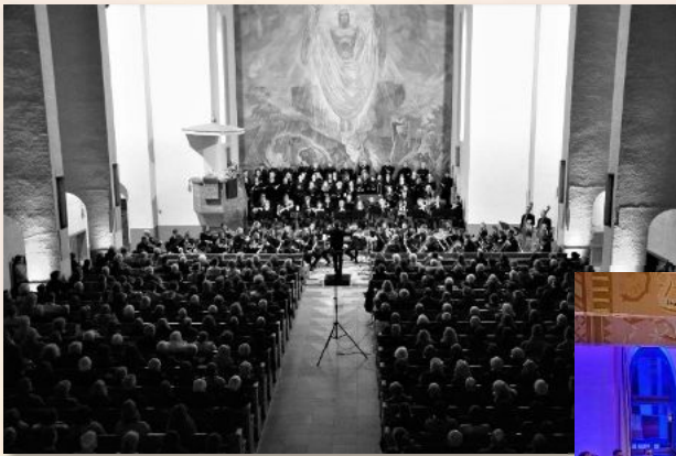
2023 „Schicksal“, u.a. Brahms Schicksalslied, Böhringer SEIN (UA) Bruchsal Lutherkirche